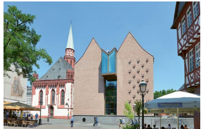
Alte Nikolaikirche und Historisches Museum