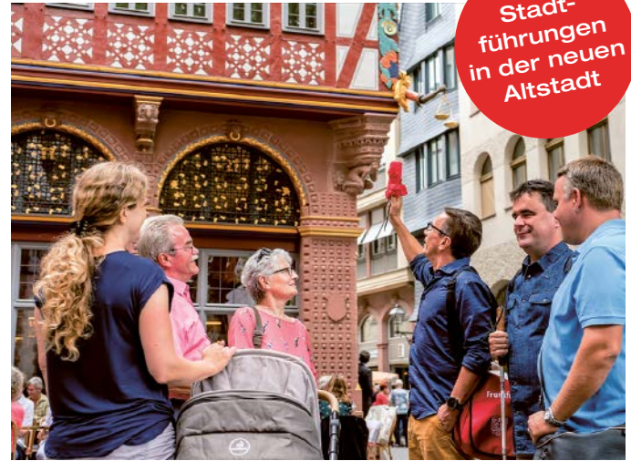
Das Haus „Goldene Waage“

Lebendige Geschichte und Altstadtflair – am 3. Oktober feiert Deutschland den Tag der Deutschen Einheit. Ein schöner Anlass, um am 3. und 4. Oktober auf die reichhaltige Geschichte Frankfurts zu blicken.