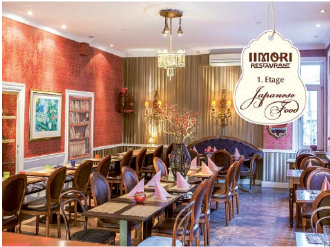
Restaurant in der Braubachstraße